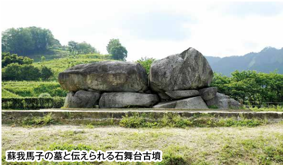
蘇我馬子の墓と伝えられる石舞台古墳