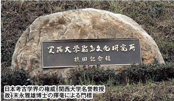
日本考古学界の権威 関西大学名誉教授 故 末永雅雄博士の揮毫による門標