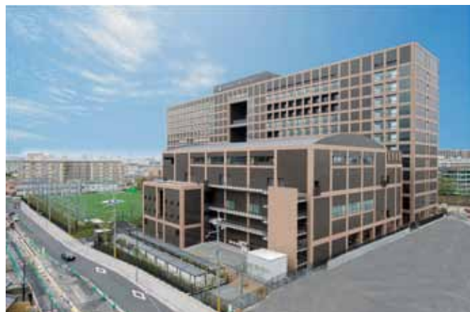
【高槻ミュージズキャンパス】

高槻ミュージズキャンパスに社会安全学部、大学院社会安全研究科、初等部・中等部・高等部が、堺キャンパスに人間健康学部が、北陽キャンパスに北陽中学校が開校しました。いずれも順調に志願者を集めてスタートし、関西大学の新たな歴史を刻むこととなりました。