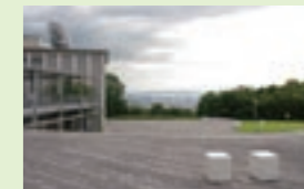
キャンパス中央の広場にあるカッブル用のイス。大阪の景色が一望できます。