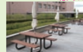
テーブルセットが設置され、学舎の間を通る風が心地よいスポットです。