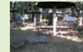
緑に囲まれたあずまや。木陰が気持ちよいスポットです。