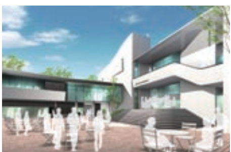
各種交流イベントも開催できるウエルカム・パティオ（中庭）

関西大学は、2012年4月に関西大学南千里国際プラザを大阪府千里留学生会館の跡地に開設します。ここには、最新の設備を備えた「日文プログラム」の施設とともに、留学生寮