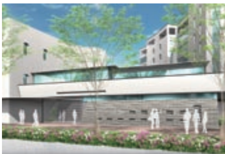
関西大学南千里国際プラザ エントランス

「日文プログラム」では、学生のさまざまなニーズに対応するために、右の図のような4つのコースを設置します。中でも、「進学コース」は「関西大学留学生別科」としての届出を文部科学省に行う予定です。履修するコースによって、基礎となる「語学クラス」を始め、目的達成をサポートするクラスを提供します。これらの対面授業によるクラスに加えて、ICT (Information and Communication Technology) を活用した教室内・外の学習メニューも提供します。