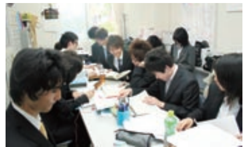
相談会に向けて準備中...

むので、授業だけでは学べない実務的な思考に触れることもできます。そして、法律相談は社会貢献活動であり、それに伴う重い責任が課されるものです。つまり、学生でありながら社会の一員としての意識を持つことができる。それはこのクラブでしか経験できない貴重なものだと思います。