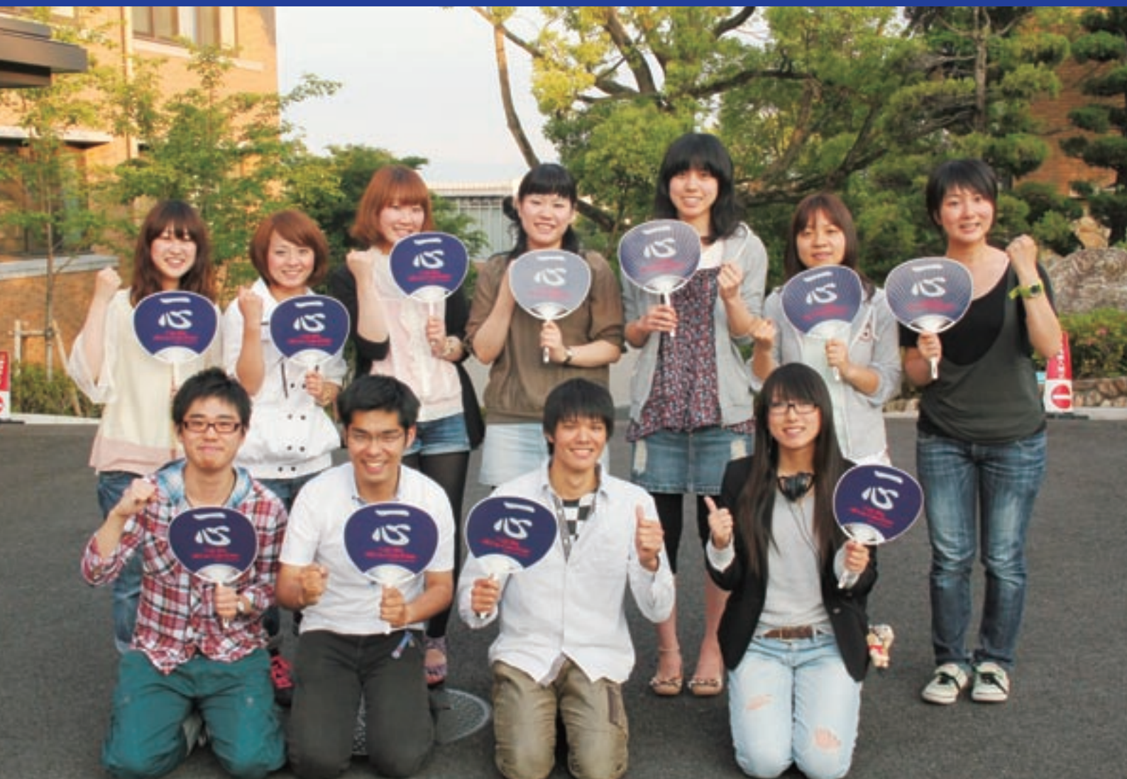
総合関関戦勝利を願う学生広報スタッフ