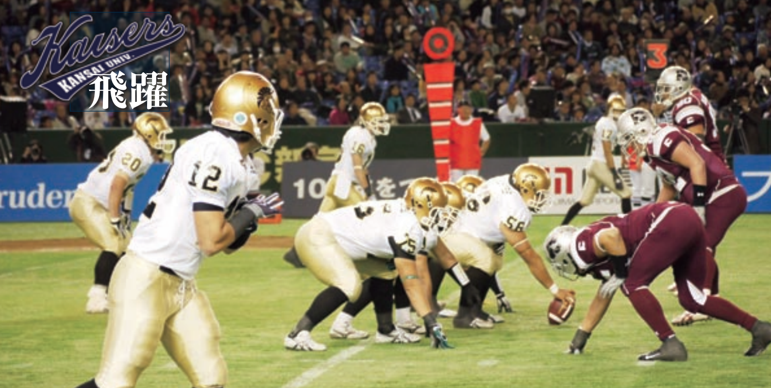
最後の最後まで闘い続けたアメリカンフットボール部 (オフェンス)