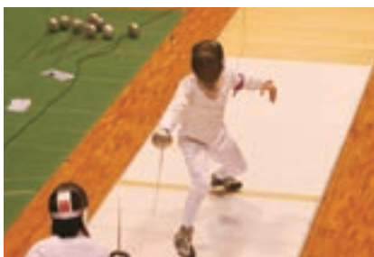
関西選手権の様子

勝、対愛知工業大戦。7点リードを許すピンチの場面で、2点差に迫いつき、チームのムードは絶好調。しかし、「気持ちが続かなかった」とメンバー全員が言うように、徐々に試合のペースを持って行かれ、結果36-45で敗北となった。悔しい結果ではあるが、次はインカレ制覇をめざす。