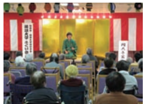
老人ホーム(福井)での一コマ。大勢のお客様に温かく迎えられました