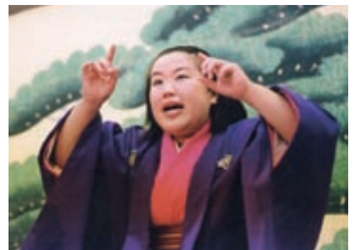
落語でも男性だけではなく、女性も舞台上で大活躍です！