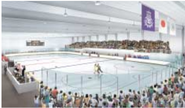
「関西大学アイスアリーナ」(平成 18 年 7 月竣工予想図)

平成 18 年度消費収支予算は、消費収支予算書のとおりですが、これを総括すると、表 2 のとおりとなります。消費収入は、学生生徒等納付金収入、職員人件費、役員報酬、退職金など、教育研究経費支出は、各設置学校の教育研究活動に必要な消耗品や業務委託費などが主な支出です。消費支出は、学生募集、設備関係支出は、学内ネットワーク整備などに伴う機械装置、第 1 学舎 5 号館（仮称）建築工事および閉西大学アイスアリーナ建築工事などに伴う機器備品購入などです。