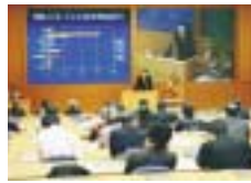
今回のシンポジウムは学外有識者、教員委員会、高等学校ならびに大学教育活動関係者が一堂に会して、この取り組みの意義と成果を検証し、プログラムの今後の可能性を探ることとして開催された。

本年度文部科学省「特色ある大学教育支援プログラム(特色GP)」に採択された本学の学校インターンシップ(人間性とキャリア形成を促す学校インターンシップ)小中大連携が支える実践型学外教育の大規模展開の一特色GP第一回公開シンポジウムが二月十六日に千里山キャンパス尚文館マルチメディアV大教室で開催された。 本プログラムは、平成十七年度には、学校・園から約千六百人の学生の受け入れ申し込み、約三百人の学生派遣という大規模な実践型学外教育として展開されている。 調印式にて河田学長(右)と明義清明日香村村長