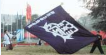
パラベラ競技場で団旗をあげる応援団