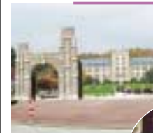
上：アナムキャンパス 右：調印式にて河田学長(空)と Yoon-Dae Euh 学長(有)

四年間を振り返ると、情報化社会の進展がさらに加速した時代であった。携帯電話やパソコンといった情報機器がより身近な存在となり、われわれの生活が便利になった。一方、著作権や肖像権の侵害、また個人情報漏洩といった情報化により、