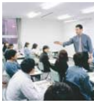
卒業生が参加するセミナーの様子

現代社会はめまぐるしく変化しています。政治、経済、産業あらゆる分野において、昨日までの常識が明日には通用しなくなることに挑戦していく姿勢で、卒業するみなさんのキャリアアップを支援する「EASTERN RITE センター」が、卒業生を支援するさまざまなプログラムを企画しています。このように時代において必要なことは、学生時代に培った知識や技術をさらに磨き、新たなスキルを身につけていくことです。卒業生は、卒業後もキャリアアップをめざす人へ、EASTERN RITE センターが、卒業生を支援するさまざまなプログラムを企画しています。このように時代において必要なことは、学生時代に培った知識や技術をさらに磨き、新たなスキルを身につけていくことです。卒業生は、卒業後もキャリアアップをめざす人へ、EASTERN RITE センターが、卒業生を支援するさまざまなプログラムを企画しています。