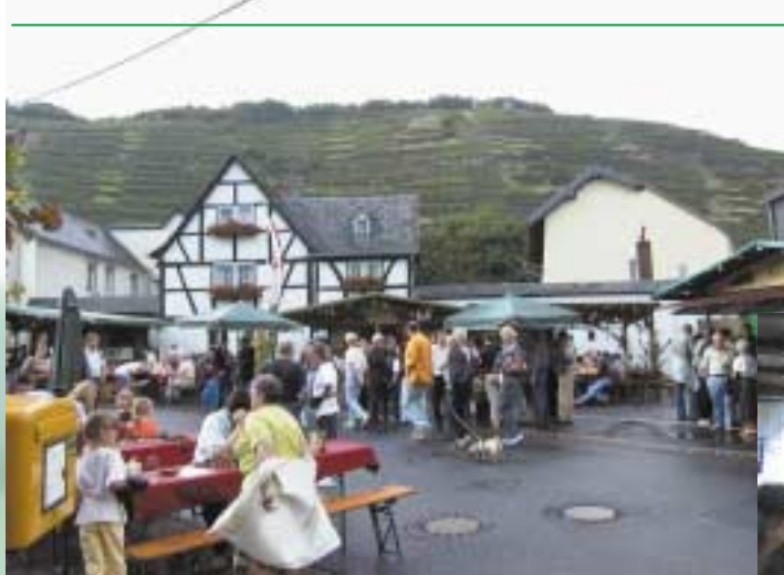
ドイツのワイン祭りの風景