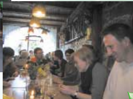
シュトラウゼで談笑する研究所のメンバーたち

南ドイツのフライブルク大学に留学中のある日、受け入れ教授から、今度研究所のメンバーで遠足をするからいらつしゃいというお誘いを受けた。行き先も聞かないまま、当日の約束の時間に研究所を訪れると、午前中の仕事を終えた教授はすでにネクタイを外してすっかりリラックスした様子である。助手や秘書らと一緒に数台の車に分乗して郊外の森に到着し、小一時間のハイキングの後、再び車に乗り込んで連れて行かれた先は、教会の屋根にコウノトリが巣を架ける静かな農村集落の中のワイン酒場だった。辛口の白ワインとフラムクーヘン(ライン川を越えたアルザス地方の名物で、ピッツアに似た食べ物)を味わいながら、隣に座った助手に、ここはどういう場所かと尋ねると、一年のうちの限られた期間しか営業しない特別なレストランだとのこと。一般にシュトラウゼというらしい。