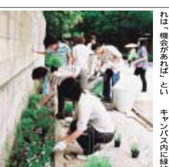
初めての花植え (6月23日、誠之館茶室裏)