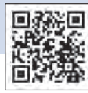
「Kan-Dai web」入学試験情報総合サイト

関西大学では、2024年度一般選抜(一般入試・共通テスト利用入試(併用))で、「滋賀試験地」、「米子試験地」、「沖縄試験地」を新たに設置する。これにより、2024年2月1～4日は全国14都市、2月5～7日は全国29都市で、札幌から沖縄まで全国各地での受験が可能となった。